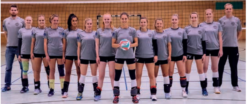
Unsere Damen 1

die letzten beiden Spieltage gegen die direkten Konkurrenten haben es in sich. Am 05.03. um 12 Uhr steht im Krupp-Gymnasium das letzte Heimspiel der Saison gegen den SV Bayer Wuppertal an. Zuschauer sind gerne gesehen, wie bei allen Heimspielen gibt es ein kostenloses Buffet inkl. Getränke für alle Fans. Am 19.03. (14 Uhr) kommt es am letzten Spieltag zum Showdown in Essen. Vamos!