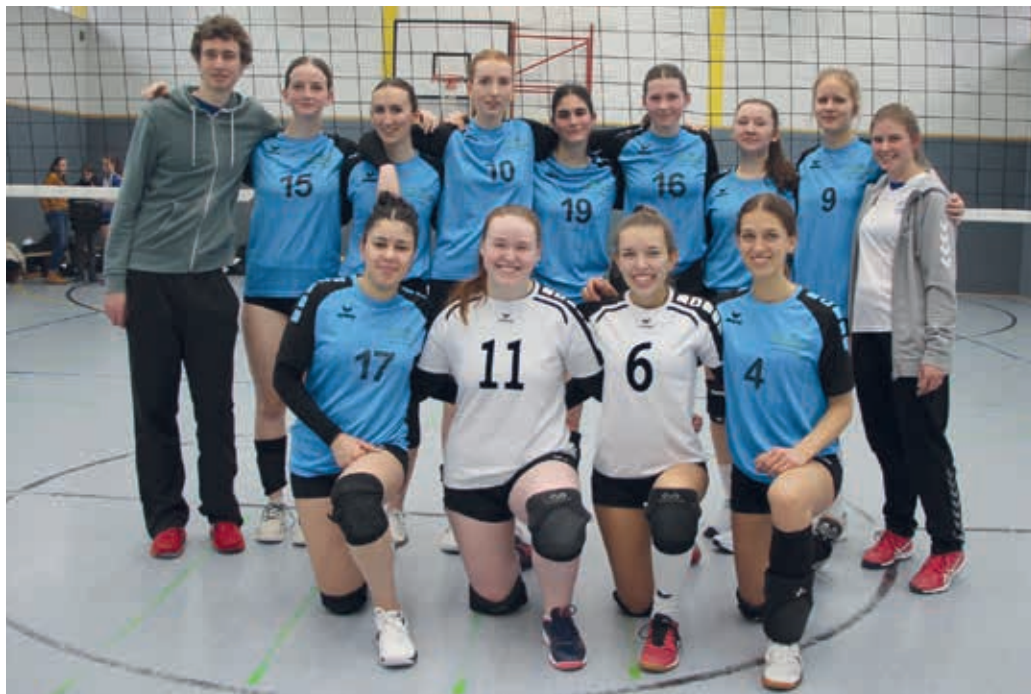
Unsere Damen 2