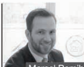
Marcel Remih FinanzierungsCenter Duisburg