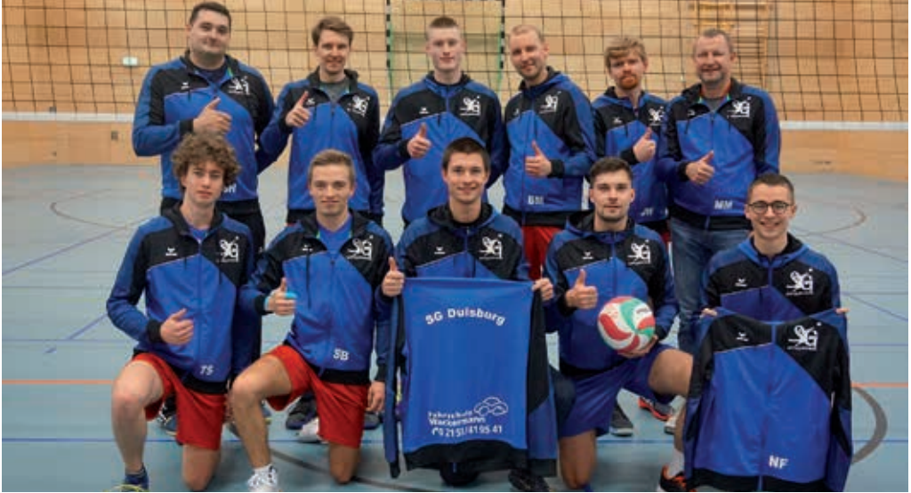
Neue Hoodies fürs Team, gespendet von der Fahrschule Wackermann aus Rumeln-Kaldenhausen