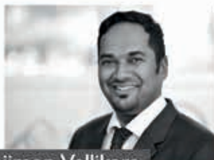
Bonjimon Vellikara FinanzierungsCenter Niederrhein