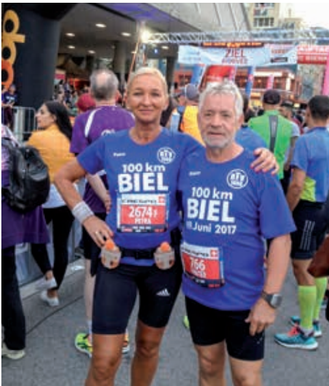
Kurz vor dem Start.

Für diesen Lauf trainierten die beiden 6 Monate und sind ca. 80 – 90 km in der Woche gelaufen. Der Trainingsabschluss war ein Vorbereitungs-Marathon Ende April in Düsseldorf.